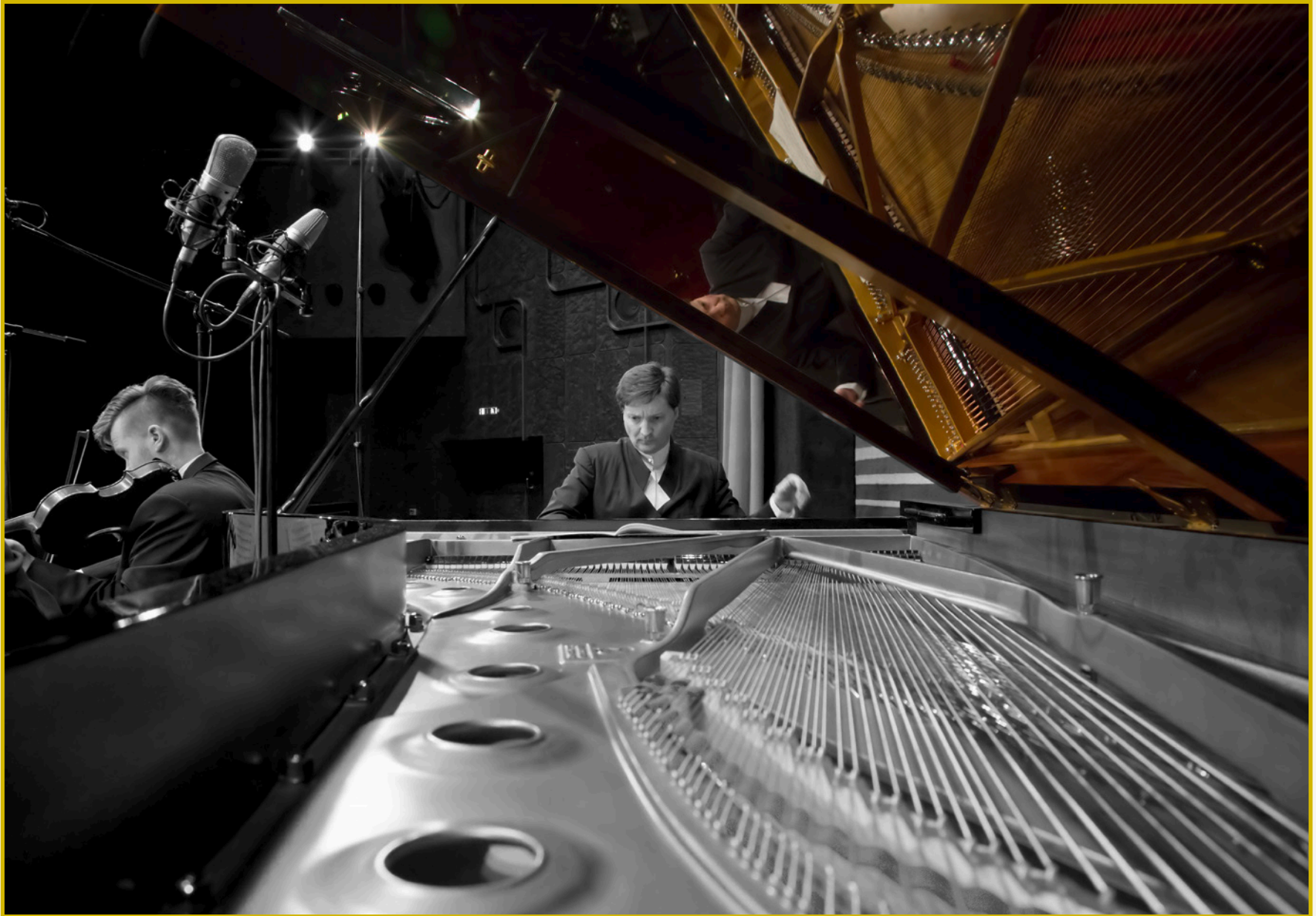
GRAND PIANO MASTERS ~ MOZART PIANO CONCERTOS No. 13 & 14 ~ SCHMIEDINGER CONCERTINO "A PIACERE"