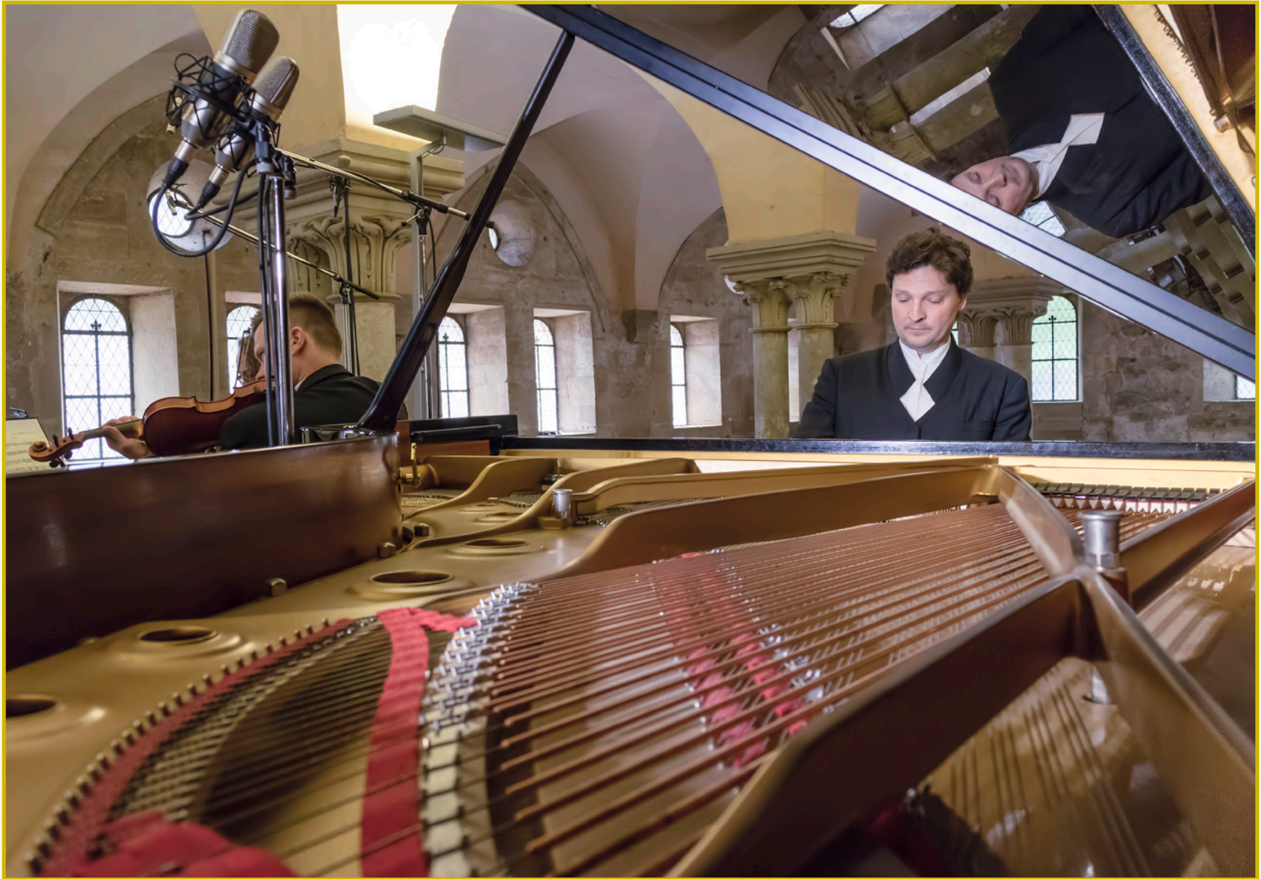
GRAND PIANO MASTERS ~ WOLFGANG AMADEUS MOZART ~ PIANO CONCERTOS NOS. 11 & 12